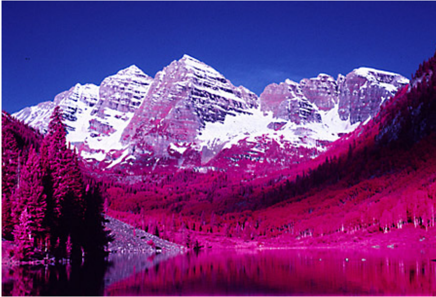
Exemplo típico de Filme Infravermelho colorido