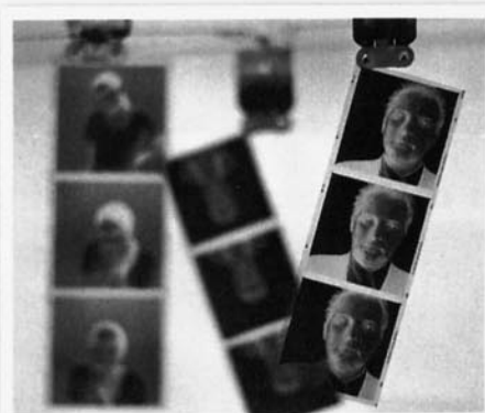
Wolfenson por Duran, do livro "Jardim da Luz"